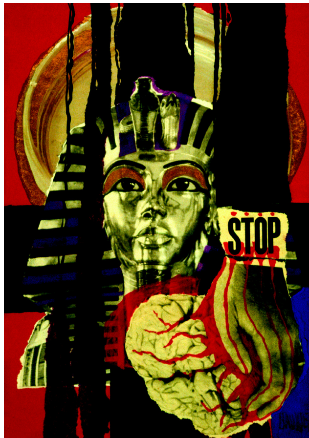
Baukje Zijlstra: Uden titel

Det kan simpelthen have en helende og helbredende værdi at få sat ord og billeder på sit indre. Med billeder kan man også sige meget mere, end man kan med ord. Og man kan udtrykke tanker og følelser, som det er svært at sætte ord på.