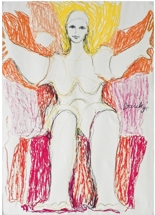
Baukje Zijlstra: Uden titel

Baukje Zijlstra sluttede billeddagbogen af med at male store farvelagte tegninger. De udgør kulminationen på hendes selvbehandling og hendes udvikling.